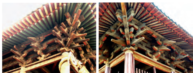
图4 山西晋祠圣母殿、献殿斗拱比较

有宋一代陆续兴建殿堂，现存中轴线由南至北山门、六师殿（遗址）、摩尼殿、大悲阁（重建）以及大悲阁前东西对峙的转轮藏殿和慈氏阁，仍保持宋代佛寺的总体布局。转轮藏殿和慈氏阁都是二层楼阁，虽经后代多次重修，但规模和外观基本相同（图3），其中转轮藏殿基本保持宋代建筑风格，改造较少，而慈氏阁上层却在清代进行了整体改造。这次重修，建筑外观和形式仍与转轮藏殿保持一致，但结构作法却完全不同，梁思成先生当年考察隆兴寺时就已注意到这一点，他指出慈氏阁“外观亦似藏殿，但结构法却完全两样。慈氏阁上檐斗拱，虽然也是单拱单杪双下昂，但是多一跳，所以多一层罗汉枋，多一跳拱。在正中线上的泥道拱（清式称正心瓜拱），却是重拱造，不似藏殿之用泥道单拱。下昂的做法，乃如明清式的昂，并不将后尾挑出，而是平置的华拱（清式称翘），在外斫成昂嘴形” [3] ，而慈氏阁上