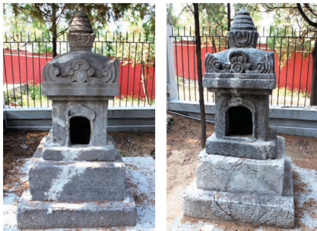
安阳灵泉寺双塔（左西右东）

结合金初善化寺三圣殿、山门等建筑，将大雄宝殿与薄伽教藏殿大木结构式样全面对比，梁思成先生敏锐地注意到以上几点细节作法差异，可为大同地区辽金建筑结构作法变迁之主要特征点——“故由此数点，不仅证此殿确系金天眷三年僧通悟等所重建，且与三圣殿等，同为辽金间建筑手法逐渐推移之信物也。” [9]