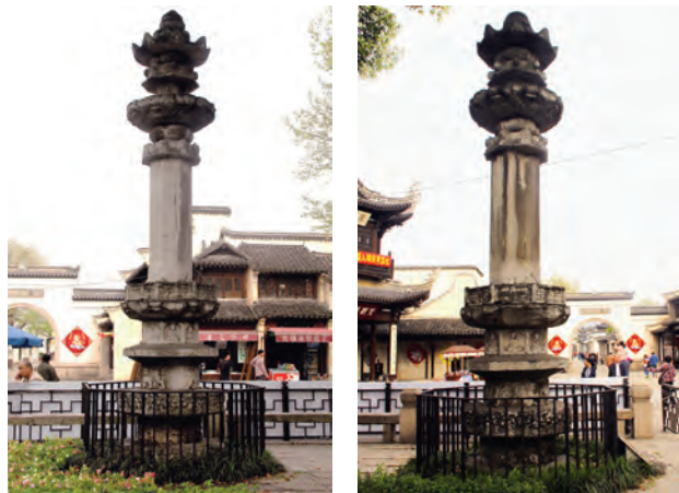
图1 无锡惠山寺唐(左)、宋(右)经幢

正宗隆兴寺原名龙藏寺, 寺内尚存隋创建之时所立的龙藏寺碑, 唐改额龙兴寺, 北宋开宝年间宋太祖赵匡胤命铸千手千眼观音铜立像, 建大悲阁, 以此为中心,