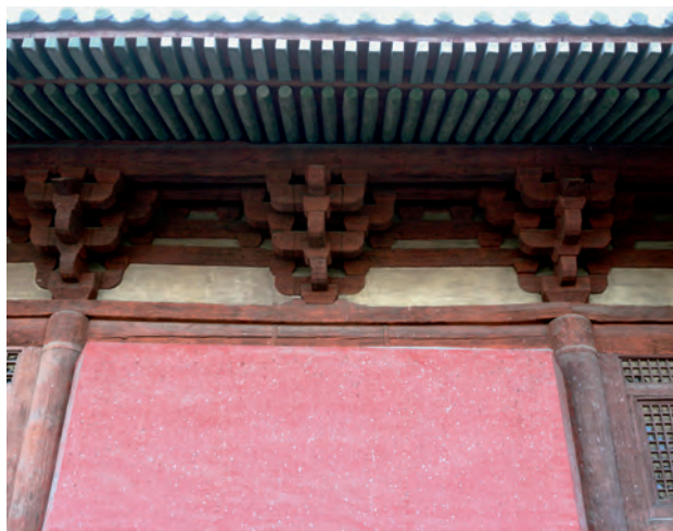
上华严寺大雄宝殿檐下