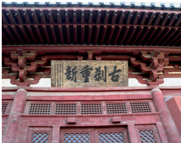
下华严寺薄伽教藏殿檐下