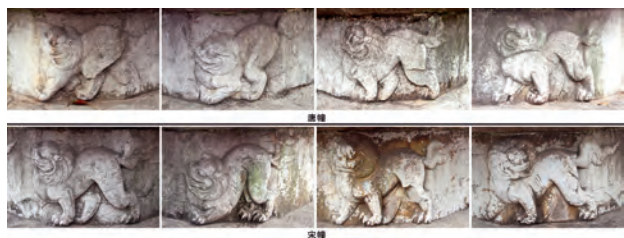
图2 无锡惠山寺唐、宋经幢细部对比